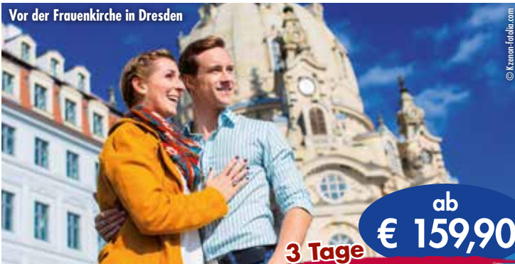
Vor der Frauenkirche in Dresden