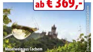
Moselwein aus Cochem