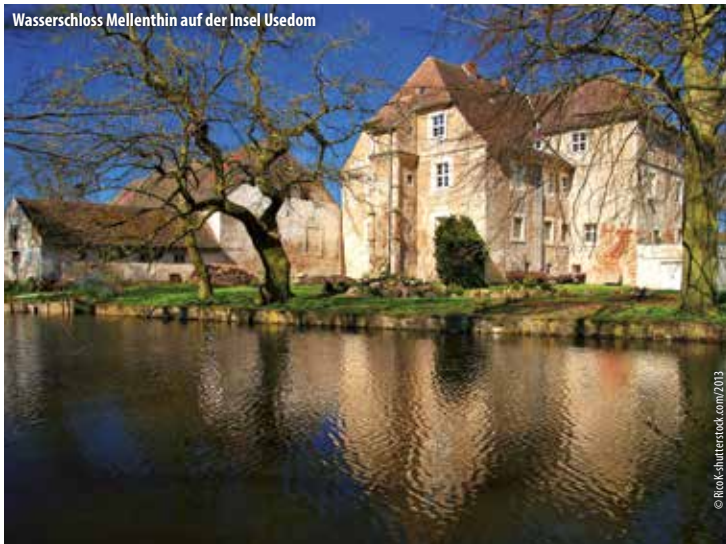
Wasserschloss Mellenthin auf der Insel Usedom

6. Tag: Heimreise Rückreise auf der Ostsee-Autobahn über Lübeck nach Hannover. Ankunft gegen ca. 19.30 Uhr.