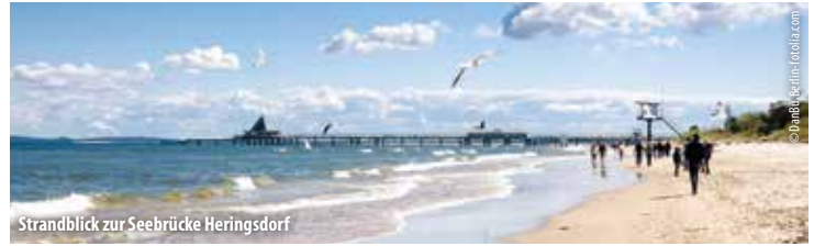
Strandblick zur Seebrücke Heringsdorf

2. Tag: Rundfahrten Teil 1 - 3 Auf den geführten Rundfahrten mit Reiseleitung entdecken wir die Insel Usedom! Wir passieren an mehreren Orten nebst mehrfachen Ausstiegen. Wir zeigen Ihnen: einige Seebäder, die Salzhäuser Koserow, das Wasserschloss Mellenthin, die Landschaft zwischen Ostsee und Pe-