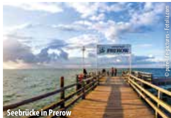
Seebrücke in Prerow