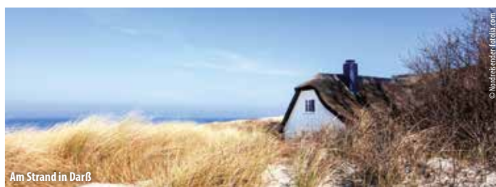
Am Strand in Darß

Die einstmals einzelnen Inseln Fischland - Darß - Zingst sind seit Jahrhunderten stetig verlandet und bilden mittlerweile die rund 55 km lange Halbinsel mit sehr schönen, langgezogenen Sandstränden. Zwischen der Landzunge und dem Festland reichen sich seichte Bodden (Mischung aus Salz- und Süßwasser) mit flachen, zum Teil verschifften Buchten, in denen viele Vogelarten Ruhe finden (größter Kranich-Rastplatz Nordeuropas). Die Ostseebäder Wustrow, Ahrenshoop, Prerow und Zingst sowie einige kleinere Orte bezaubern mit ihren reetgedeckten Fischerhäusern, ihrem Flair und den landestypischen Eigenarten. Das Land unterm Wind, zwischen Bodden und Meer, zerklüftet, bizarr, von herber Schönheit, ist jederzeit in Bewegung - diese Reise bietet Ihnen Abwechslung und gleichzeitig unvergessliche Erlebnisse!