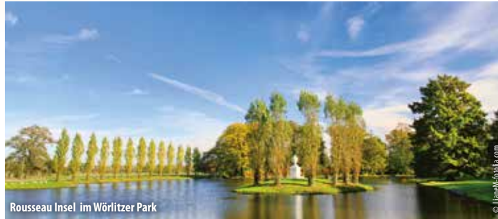
Rousseau Insel im Wörlitzer Park