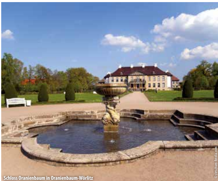
Schloss Oranienbaum in Oranienbaum-Wörlitz