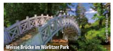
Weiße Brücke im Wörlitzer Park

3. Tag: Heimreise Unser Tipp - genießen Sie zu früher Stunde den Park oder die Badelandschaft des Hotels! Vormittags nehmen wir Abschied von Wörlitz und fahren über Dessau, Aken, Calbe nach Schönebeck/Bad Salzelmen zum Aufenthalt bei den Gädierwerken - ein Erlebnis! Rückfahrt über Magdeburg nach Hannover. Ankunft um ca. 19.30 Uhr.