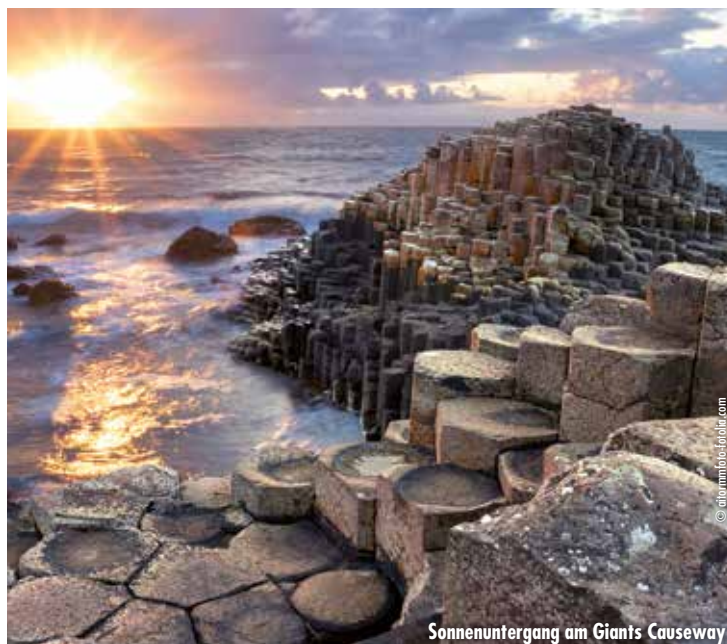
Sonnenuntergang am Giant's Causeway

Frühstück an Bord. Ankunft in Amsterdam/Ijmuiden am frühen Morgen. Rückfahrt nach Hannover. Ankunft ca. 18.00 Uhr