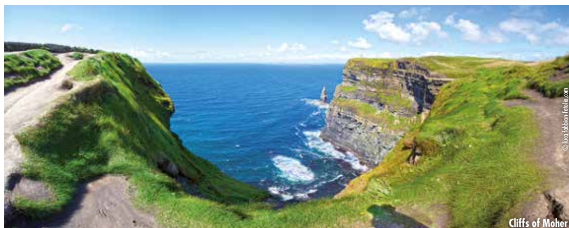
Cliffs of Moher

Heute fahren wir von Kilkenny durch die Karstlandschaft der Burren Region - eine faszinierende Steinwüste - bis zu den bekannten Cliffs of Moher. Von Irlands bekanntesten Steilklippen, die bis zu 214 m hoch aus dem Meer ragen, haben Sie einen atemberaubenden Ausblick. Der Eintritt in das Besucherzentrum ist inklusiv. Anschließend Weiterfahrt zur Hotelübernachtung im Raum County Clare. Abendessen im Hotel.