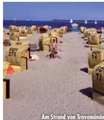
Am Strand von Travemünde

Sie genießen einen Kurzurlaub im MARITIM Strandhotel Travemünde direkt am wunderschönen Ostseestrand gelegen. Der Hafen ist nur wenige Schritte entfernt, von dem aus Fäh- und Kreuzfahrtschiffe nach Skandinavien und ins Baltikum ihre Reise antreten. Das Hotel ist idealer Ausgangspunkt für Ausflüge aber auch genauso perfekt gelegen für einen entspannten Tag im Strandkorb. Am Rückreisetag pausieren wir in der Hansestadt Lübeck zur geführten Stadtbesichtigung nebst Aufenthalt. Abfahrt Hannover um 9.00 Uhr Rückankunft ca. 18.30 Uhr