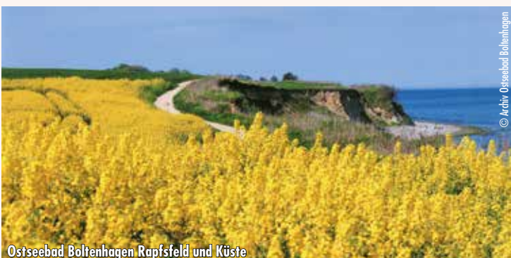
Ostseebad Boltenhagen Rapsfeld und Küste

Die Kurtaxe entrichten Sie bitte vor Ort! Mindestteilnehmerzahl: 28 Personen