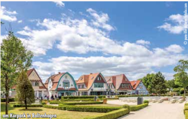
am Kurpark in Boltenhagen