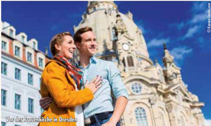
Vor der Frauenkirche in Dresden

1.Tag: Abfahrt von Hannover um 9:00 Uhr Auf der BAB über Helmstedt, Raum Magdeburg - Halle - Leipzig. Weiterfahrt zu unserem Vertragshotel nach Dresden. Anschließend Freizeit. Unser Tipp: Unternehmen Sie einen Stadtbummel und besuchen Sie Dresdens Sehenswürdigkeiten.