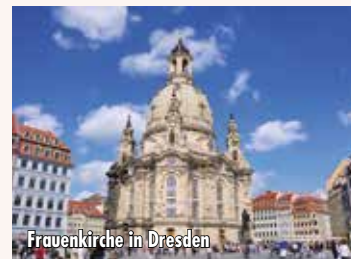
Frauenkirche in Dresden

3. Tag: Dresden - Heimreise In aller Ruhe das Frühstück genießen - danach erfolgt die Gepäckverladung. Abfahrt von Dresden nach der Mittagszeit. Rückkehr in Hannover ca. 18:30 Uhr.