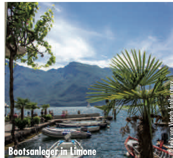
Bootsanleger in Limone