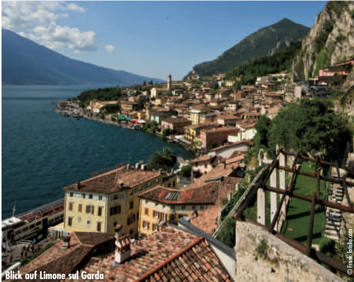
Blick auf Limone sul Garda

Von Limone über Würzburg nach Hannover. Ankunft bis 21:00 Uhr.