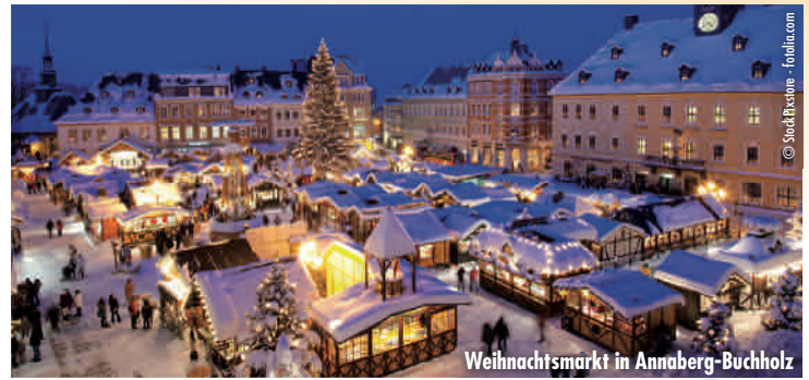
Weihnachtsmarkt in Annaberg-Buchholz