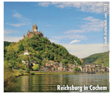
Reichsburg in Cochem

3. Tag: Deutsches Eck - Romantischer Mittelrhein - Rheingau / Rudesheim Es ist naheliegend, dem „Deutschen Eck“ und dem Reiterdenkmal Kaiser Wilhelm I. in Koblenz einen Besuch abzustatten. Danach fahren wir am romantischen Rhein entlang. Die Panoramastraße dieses unvergleichlichen Flusslaufes offenbart eine unglaubliche Vielfalt an Überraschungen und sorgt für Bilder, die sich einprägen. Bezaubernde Landschaften, stolze Burgen, Schlösser und Ruinen, berühmte Klöster, Weingüter und Weinberge bereichern diesen einzigartigen Kulturreichtum am „Deutschen Rhein“. Wir kommen an der hochaufragenden Marksburg vorbei, fahren zum viel besungenen Loreleyfelsen hinauf, passieren die Blücherstadt Kaub mit der Rheinpfalz und fahren auf der bekannten Rheingauer-Riesling-Route bis Rudesheim. Gegen 15.00 Uhr verlassen wir Rudesheim in Richtung Wiesbaden und treten die Heimfahrt an. Rückankunft in Hannover bis 20:00 Uhr.