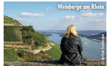
Weinberge am Rhein