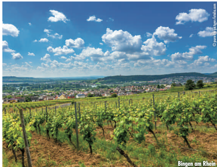
Bingen am Rhein

Unser Hotelpartner ist das Caravelle Hotel im Park (3 Sterne), Bad Kreuznach. Ruhige Lage zwischen Nahe-Ufer und Oranienpark, inmitten des schönen Kurviertels. Ausstattung: Restaurant, Weinstube, Wellnessbereich mit Schwimmbad, Sauna, Solarium, Whirlpool und Sonnenterrasse. Zimmer mit Bad bzw. Dusche/WC, Telefon, Kabel-TV.