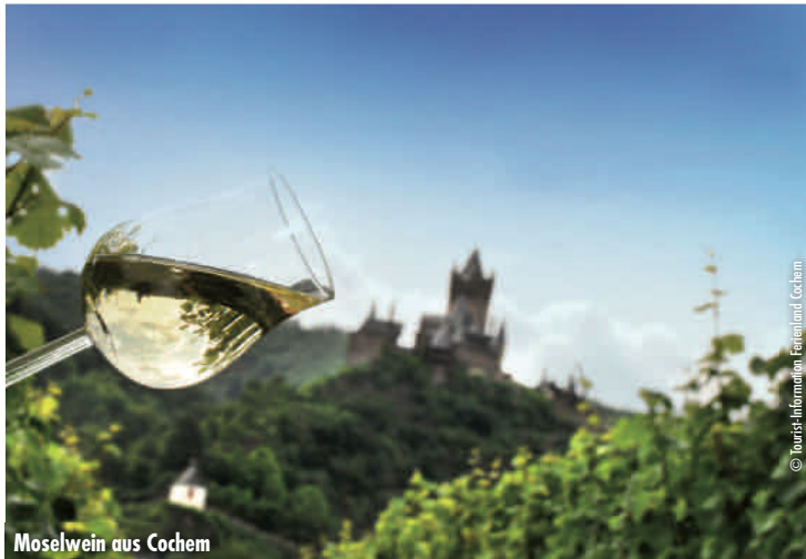
Moselwein aus Cochem