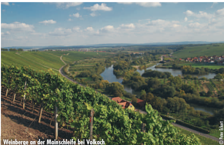
Weinberge an der Mainschleife bei Volkach

13.08. - 15.08. (Mo-Mi) € 299,- Einzelzimmerzuschlag € 37,- Mindestteilnehmerzahl: 28 Personen